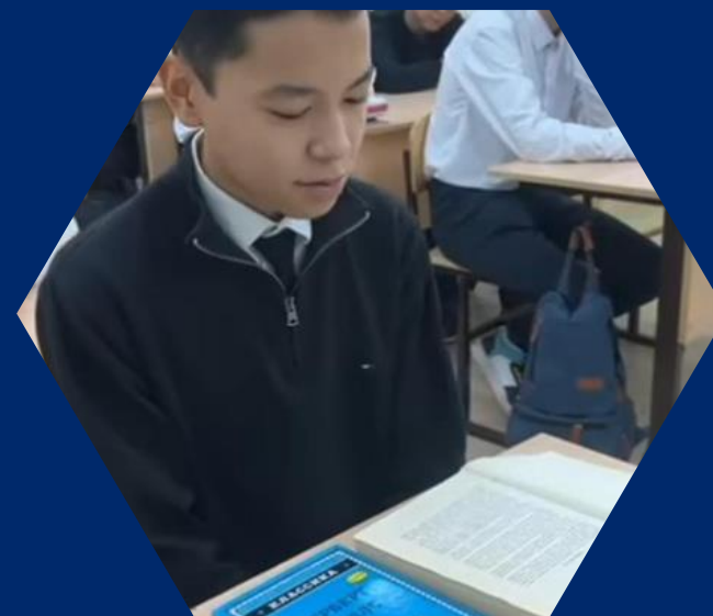
«8 минуттық оқу» жобасы