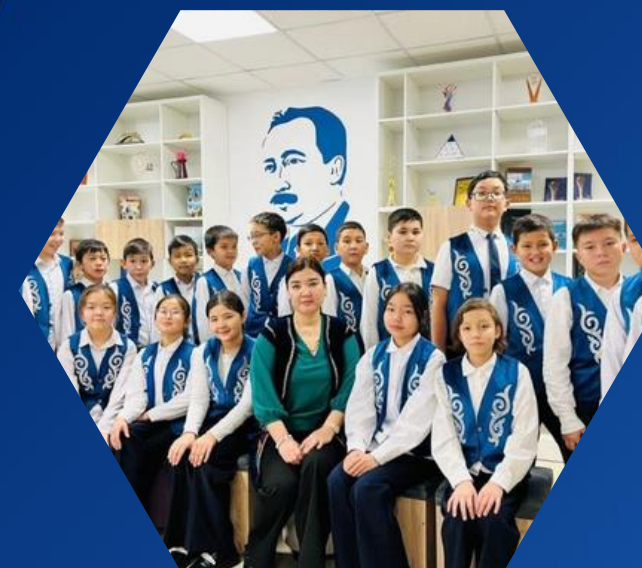
Ұлттық киім күні